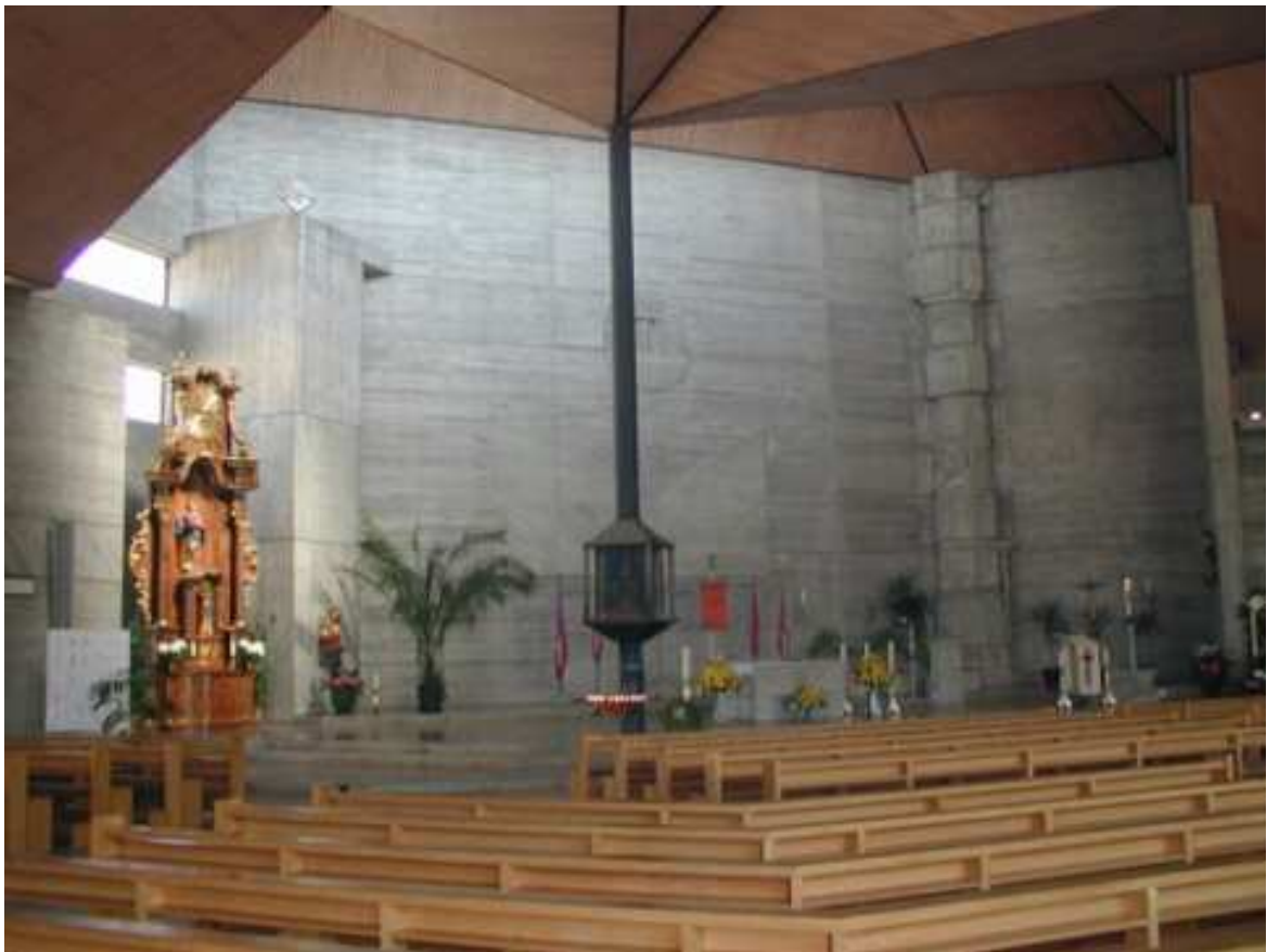
Innenraum mit Altar und barockem Sakramentsaltar sowie Josefshäuschen

Sie ist eine räumlich große Kirche: Ca. 750 Sitzplätze und etwa ebenso viele Stehplätze stehen zur Verfügung. Geht man durch das Hauptportal, betritt man nach allen Seiten hin einen hell belichteten Raum, dessen Licht teils direkt durch die großen Lamellenfensterwände, teils indirekt durch die umlaufenden Lichtbahnen zwischen Dach und Wand und durch Lichtschlitze im Altarbereich einfällt. Die Grundfarbe wird vom Sichtbeton, dem hellen Holzgestühl und den Bretterverschalungen der Deckenfelder bestimmt. Das Gestühl umgreift, in 7 verschiedenen breiten Bankkolonnen im Breitraum angeordnet, den Altarraum, der um drei Stufen erhöht ist und von allen Plätzen frei eingesehen werden kann.