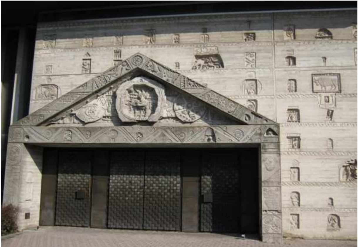
Hauptportal Ansicht der Kirche vom Marktplatz aus

Der in der Nähe, aber dennoch abseits des Portals stehende alte Glockenturm der abgebrochenen Kirche fügt sich vorzüglich zu den langgezogenen, horizontalen Formlinien des Kirchgebäudes. Der (alte) Turm aus grau-rötlichen Haustein-Mauerwerk mit Eckquadern aus rotem Sandstein und die naturbelassenen schalrauhnen Betonwände der (neuen) Kirche integrieren sich gegenseitig. Die Feinheit der Farbtöne zeigt eine überraschende Einheitlichkeit der beiden Gebäudeteile: Materialien und Maßstäblichkeit schließen den historischen Turm organisch an die neue Kirche und schafft eine nicht zu übertreffende Einheit.