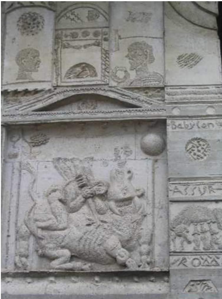
Der Mithras-Stier Ausschnitt aus der Prophetenwand

Nur noch wenige Schritte sind es dann bis zum Hauptportal, dessen in Beton gegossene Bilder des Giebelfeldes alle im Zeichen der Apokalypse stehen. In der Mitte des Giebels ist das Lamm auf einem Thron: Es ist umgeben von 4 Wesen und wird flankiert links von der Braut des Lammes (Kirche) und rechts den Mächtigen der Erde, deren Namen eingespannt sind wie die Speichen in das sich drehende Zeitrad. Spiegeln sich in den Wangen des vorgezogenen Portalkörpers die Zeit des Menschen in Gegenbildern, kommt die Liebe auf den Portalinnenseiten deutlich in Erscheinung: Liebend beugt sich eine Mutter über ihr Kind.