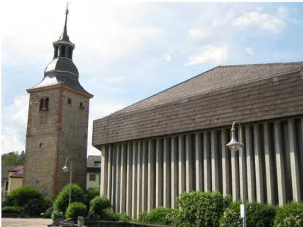
Kirchturm mit Neubau

Der frei vor dem Haupteingang stehen gebliebene alte Glockenturm der abgebrochenen Kirche hat grau-rötliches Hausteин-Mauerwerk mit Eckquaderung aus rotem Sandstein. Die historische Form des Turmes fügt sich in die langgezogenen horizontalen Formlinien des Kirchengebäudes ein. Das Mauerwerk und die naturbelassenen schalgrauen Betonwände der Kirche integrieren sich gegenseitig, denn Materialien und Maßstäblichkeit schließen den historischen Turm organisch an die neue Kirche.