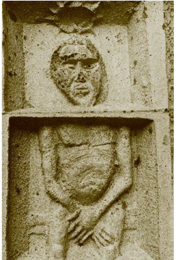
Christus, der neue Adam

Auffällig und eben sofort ins Auge fallend sind die zahlreichen in Beton gegossenen Bilder, außen wie innen: Einmalig ist die künstlerische Gestaltung der Kirche. Planer und Pfarrer ließen Wachter die Freiheit, seinen Beitrag an der Verkündigung in den unmittelbaren Bauprozess einzubringen. Gleichzeitig mit der Holzverschalung für den Betonguss einer Wand wurde das jeweilige reliefartige Bild in Negativform eingeschalt. Für dieses Negativgussverfahren wählte der Künstler Styropor, das leicht schneidbar ist, aber auch mit Glühdraht zu bearbeiten war. Wohl auch bei diesen Verschalungsarbeiten wirkte das bekannte "Gottvertrauen" mit, denn ein Probeguss konnte nicht experimentiert werden. Die herausgearbeiteten und freigelegten Reliefs zeugen von einer besonderen Note: Die Gegensätze rauh-glatt geben ein besonderes Bild. Wachter: "Die zum Bild gewordene steinerne Masse bietet das erregende Erlebnis einer Fleischwerdung in Stein. Der Beton bekommt Gesichter."